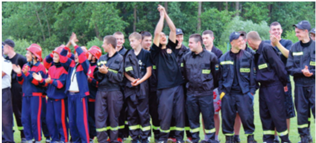
OSP Pruszynek cieszy się ze zwycięstwa

- W naszej Gminie funkcjonują obecnie 4 jednostki OSP. Nie jest to dużo, jak na samorząd, który liczy 17 tysięcy mieszkańców. Zwłaszcza, jeśli przypomnimy sobie czasy, kiedy mieliśmy w Gminie 13 straży. Na tę sytuację trzeba jednak spojrzeć także z innej strony. Przy takiej liczbie straży samorząd może lepiej zadbać o ich bazę materialną, łatwiej znaleźć fundusze na dofinansowanie jednostek. Nasze OSP są dobrze wyposażone, dysponują nowoczesnymi samochodami.