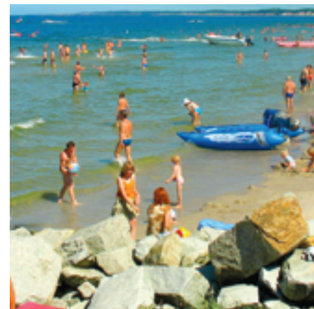
Uczniowie Zespołu Oświatowo-Wychowawczego w Białkach w ramach projektu wyjadą nad morze

W ramach projektów prowadzone są zajęcia z integracji społecznej, tematyczne, integralne zajęcia artystyczne. W czasie wakacji uczniowie wyjadą na bezpłatne wycieczki w góry i nad morze.