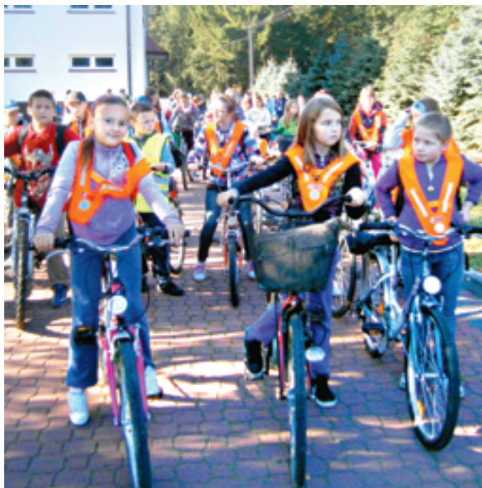
Uczniowie z Golic pamiętają o swoim bezpieczeństwie

Prowadzona przez Gminną Komisję Rozwiązywania Problemów Alkoholowych akcja „Bezpieczna Gmina Siedlce” adresowana jest przede wszystkim do uczniów ze szkół gminnych, których