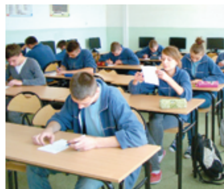
Uczniowie z Białek zajęli pierwsze miejsce w konkursie „Polskie drogi do niepodległości”.

Zespół Oświatowy w zakończonym roku szkolnym pochwalić się może sukcesami w różnych formach rywalizacji. Uczniowie wygrywali gminne konkursy i festiwale. Ale mieli też sukcesy rangi krajowej. Do nich zaliczyć należy pierwsze miejsce w 57. Mazowieckim Turnie-