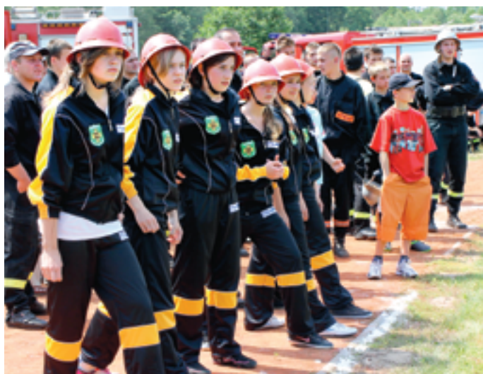
Drużyna dziewcząt z Nowego Opola