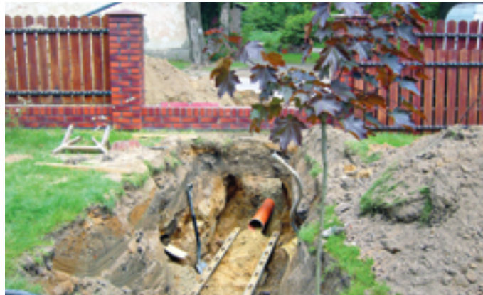
Prace przy budowie sieci kanalizacyjnej na ul. Akacyjnej w Żelkowie-Kolonii

Dla mieszkańców najistotniejsze jest to, że inwestycje pomogą im rozwiązać problem odbioru nieczystości. Trzeba pamiętać, że wejście Polski do Unii Europejskiej to także zobowiązanie do dostosowania się do norm i przepisów w dziedzinie ochrony środowiska. Chodzi tu m.in. o obowiązek rozbudowy i modernizacji systemów kanalizacyjnych oraz budowy oczyszczalni ścieków, które będą spełniały najwyższe wymogi ochrony środowiska. Przepisy prawne UE w zakresie odprowadzania i oczyszczania ścieków komunalnych będą w Polsce w pełni obowiązywały od 31 grudnia 2015 r.