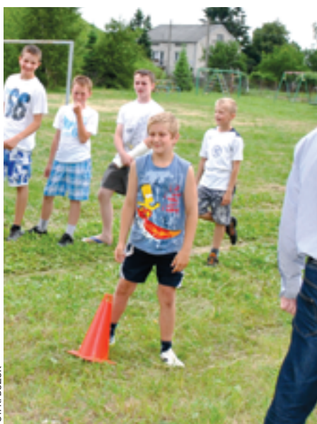
Zajęcia organizowane są w sześciu miejscowościach - Grabianowie, Grubalach, Nowym Opolu, Pruszyńku, Rakowcu i Ujrzanowie