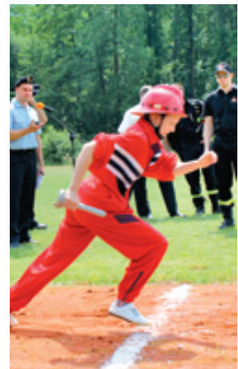
Start sztafety dziewcząt z Błogoszczy

mi. Dziś strażacy częściej do pożarów wyjeżdżają do akcji związanych z ratownictwem drogowym czy usuwaniem skutków anomalii pogodowych. Muszą dysponować odpowiednim sprzętem i fachową wiedzą z zakresu ratownictwa medycznego. Nasi druhowie dobrze wywiązują się z obowiązków. Dbają nie tylko o sprzęt i poziom wyszkolenia, ale są aktywni w swoich społecznościach. Za to serdecznie im dziękuję - powiedział M. Bieniek.