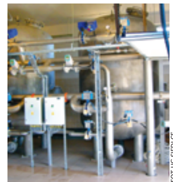
W obiekcie zamontowano nowoczesne urządzenia

w Stoku Lackim zasila w wodę mieszkańców kilkunastu miejscowości w Gminie Siedlce. Dzięki realizacji inwestycji poprawi się jakość wody i zmniejszy ryzyko awarii urządzeń służących zasilaniu wodociągow. ■